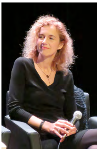
Boualem Sansal et Delphine de Vigan